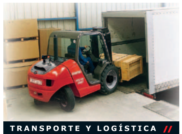
TRANSPORTE Y LOGÍSTICA //